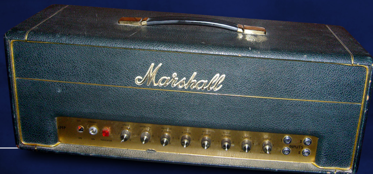
1968 Marshall JMP Tremolo Plexo.