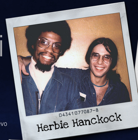
04341077087-8 Herbie Hancock

R: En un video de Youtube de la época de School Days hay un comentario sobre eso. Alguien dice que no era accesible esa música y si que lo era. Yo veía en USA en la tele a Return to Forever...Cream y Hendrix hicieron muchas televisiones y ahora sólo ves a Britney Spears. Se veía fusión en la tele y Hendrix o Cream llegaban al nº1 en ventas.