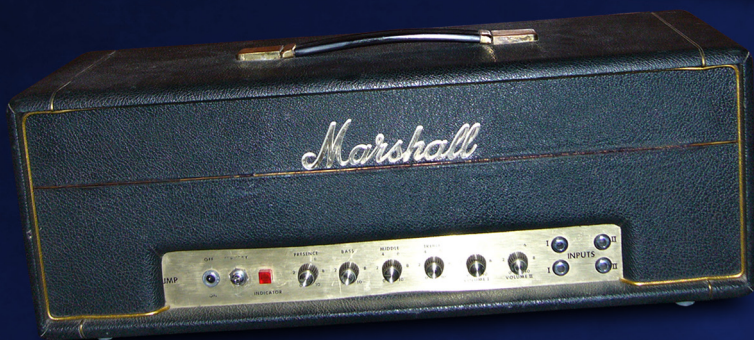
1969 Marshall JMP Small Box 50