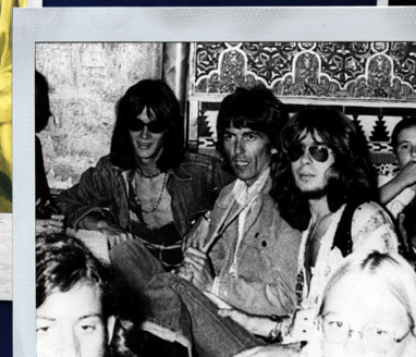
04341077087-8 George Harrison