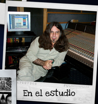
47007348 En el estudio