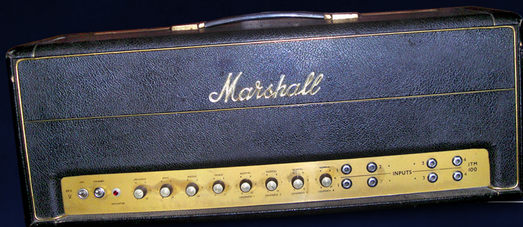
1966 Marshall JTM 100 Super PA