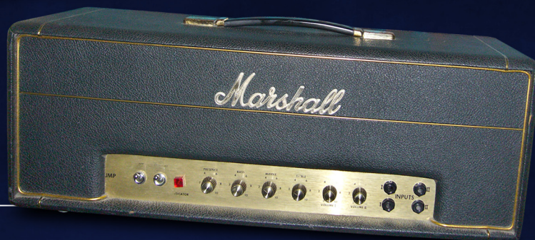
1969 Marshall JMP Small Box 50