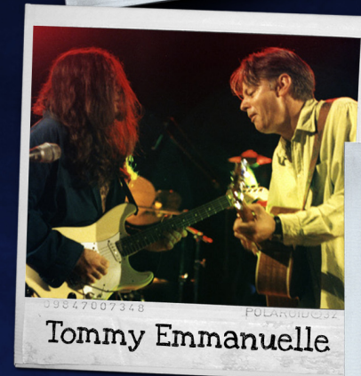
09847007348 Tommy Emmanuel